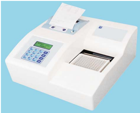
LECTOR DE ELISA